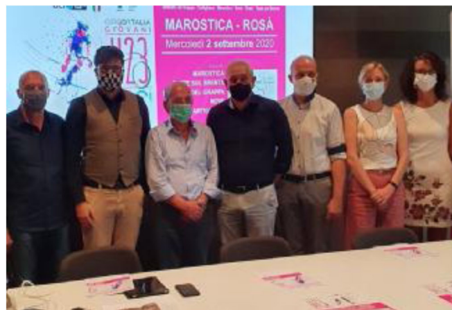
La presentazione della tappa del Giro Giovani alla Ursus di Rosà